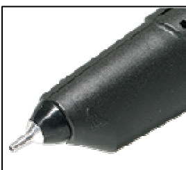
12 mm lange Schaftdüse mit Gummischutz