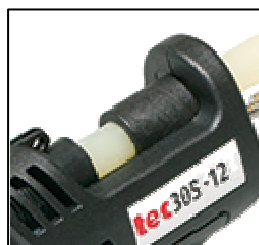
Für 12 mm Schmelz- kleberpatronen