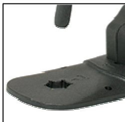
Abnehmbarer Geräteständer mit Düsenschlüssel